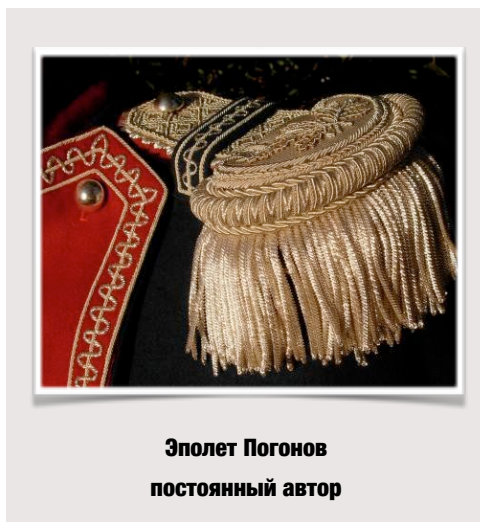
Эполет Погонов постоянный автор

В сфере обеспечения безопасности прилагательное "профессиональный" приобретает особый смысл и значимость. Его